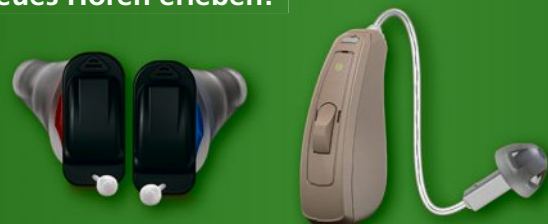
Silk X von Signia

Einfach ausschneiden und 4 Wochen lang Ihr neues Hören erleben!