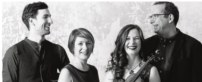
Cara geben sich multikulturell und spielen auch so.

Die Veranstaltung findet Open Air auf dem PUC-Hügel