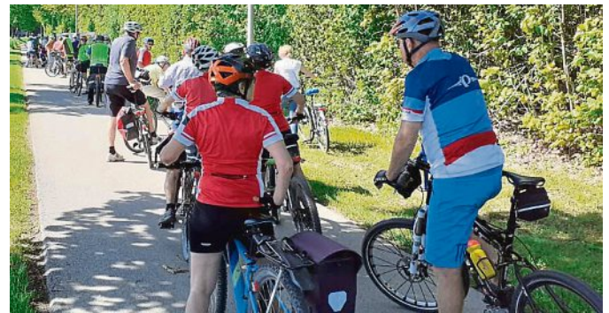
Die Stadtradeln-Auftakttour fand bei bestem Radelwetter statt.